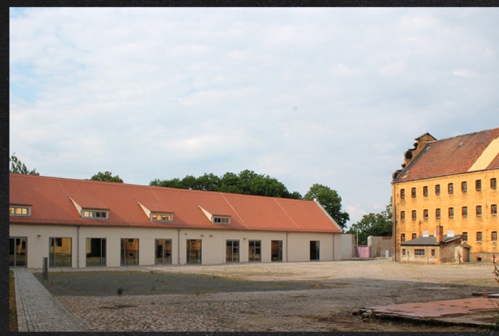
Foto: Gedenkort für die Opfer der Wehrmachtjustiz vor dem Fort Zinna - Archiv StSG/IZ Torgau Blick in die Dauerausstellung in Schloss Hartenfels - Archiv StSG/DIZ Torgau

Gedenkstätte KZ Lichtenburg Prettin Prettiner Landstraße 4 D-06925 Annaburg / OT Prettin