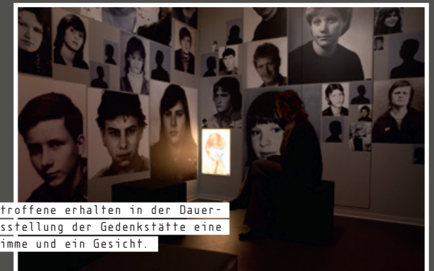
Betroffene erhalten in der Dauerausstellung der Gedenkstätte eine Stimme und ein Gesicht.