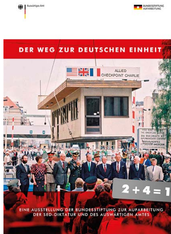
Ausstellung „Der Weg zur deutschen Einheit“