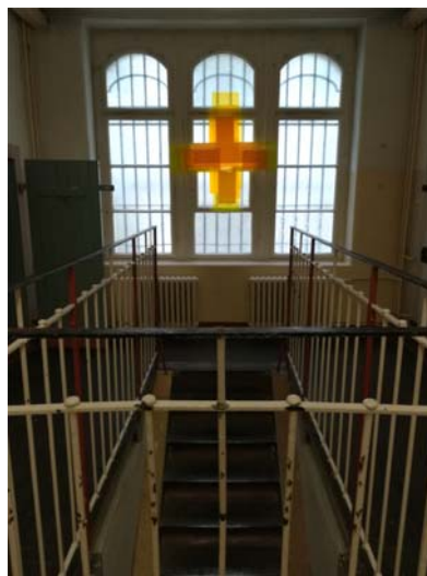
Ludger Hinses Kunstinstallation „Das Leid der Welt“ in der Gedenkstätte Bautzen (© Stiftung Sächsische Gedenkstätten/Gedenkstätte Bautzen)