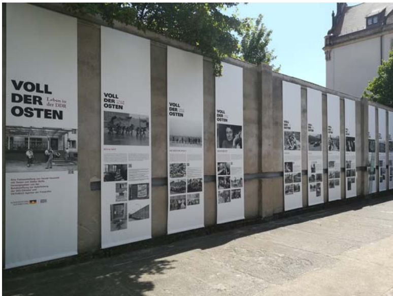
„Voll der Osten. Leben in der DDR“, Fotoausstellung von Harald Hauswald mit Texten von Stefan Woll, herausgegeben von der Bundesstiftung zur Aufarbeitung der SED-Diktatur und der OSTKREUZ Agentur der Fotografen

Hochauflösende Pressefotos zur Darstellung der Gedenkstätte Bautzen finden Sie für Ihre Berichterstattung im Pressebereich unter http://www.stsg.de/cms/bautzen/pressefotos_downloads