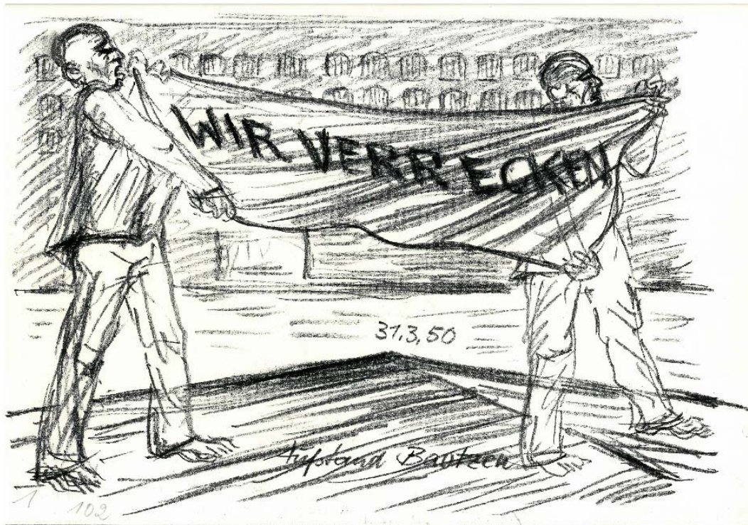
"Wir verrecken", Wilhelm Sprick, ohne Jahr

Hochauflösende Pressefotos zur Darstellung der Gedenkandacht an den Gefangenenaufstand finden Sie für Ihre Berichterstattung im Pressebereich unter http://www.stsg.de/cms/bautzen/pressefotos_downloads