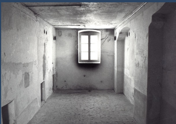
Gaskammer der Tötungsanstalt Pirna-Sonnenstein Foto: Jürgen Lösel, 1995