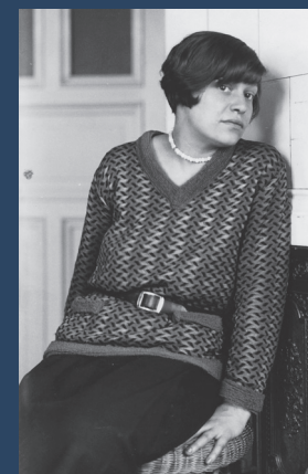
Elfriede Lohse-Wächtler - um 1928 in Hamburg Elfriede Lohse-Wächtler Archiv